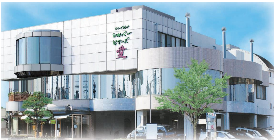
ピアーズグループ 本社ビル